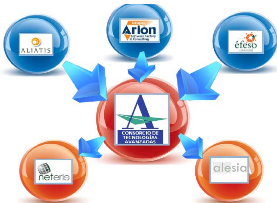
Gráfico de configuración del nuevo Clúster Empresarial:

Las previsiones de facturación del Clúster para el año 2011 es llegar a cifra de 44 millones de euros y contar con una plantilla de aproximadamente 350 trabajadores .